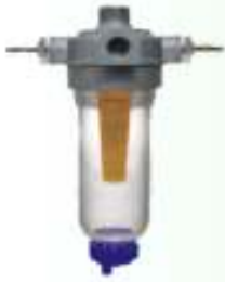
Μονή Συσκευή fmo® Πετρέλαιο Κωδ. 0811- ....