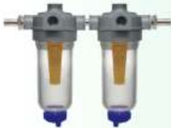
Διπλή Συσκευή fmo® Πετρέλαιο Κωδ. 0822- ....