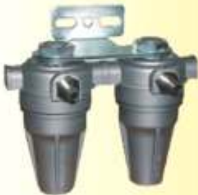
Διπλή Συσκευή fmo® Βενζίνη Κωδ. 0802-....