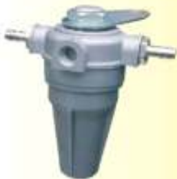
Μονή Συσκευή fmo® Βενζίνη Κωδ. 0801-....